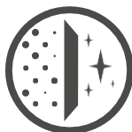
Reguliert das Raumklima