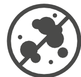
Schimmelbildung wird vermieden