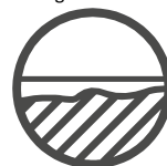
Unebene Oberflächen ausgleichen