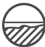
Unebene Oberflächen ausgleichen